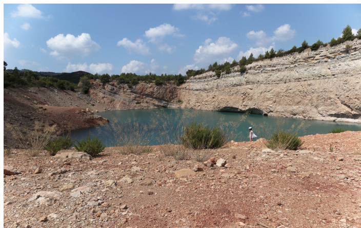
Ancienne carrière de bauxite - Mas Rouge

J'ai pris deux exemples de sites paysagers, l'un dans le périmètre proposé, l'autre dans un synclinal voisin à celui des Baux-de-Provence : à l'inverse du village, c'est la confidentialité qui fait leur attrait. Les Alpilles, c'est aussi ces centaines de sites à découvrir, magiques et secrets. Il semble que l'unanimité se fasse autour du principe de conscience paysagère discrète.