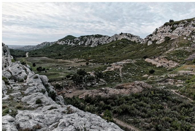
Oppedum des Caisses de Jean-Jean - Mouriès

Derrière cela, il faut y voir un prolongement vers un paysage culturel au sens donné par l'UNESCO, le Carnet (vivant) paysages des Alpilles initié en 2011 en témoigne (initiative PNRA). Inutile d'énumérer les critères, tant la préhistoire et l'archéologie, la géologie particulière entre soulèvements alpins et pyrénéens, l'hydraulique, la romanité, l'agriculture et le pastoralisme, et conséquemment la littérature, en dévoilent les secrets. Finalement, les Baux-de-Provence ne sont qu'un écrin qui résume ce cocktail patrimonial reçu en héritage, l'arbre emblématique qui cache la forêt, la pierre angulaire de Provence et par les faits, victime expiatoire du tourisme... A minima faudra-t-il intégrer le réseau des Grands Sites de France, pour que l'effort collectif de développement durable monte en puissance dans le périmètre du Parc (PNRA).